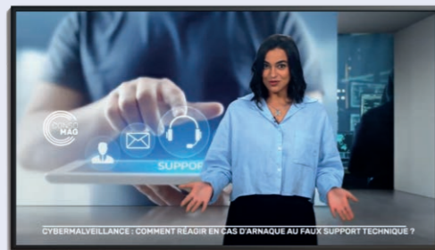
Campagne nationale TV-médias de sensibilisation à la cybersécurité, diffusée sur les chaînes du groupe France Télévisions.