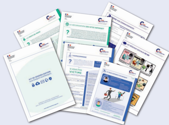
Kit de sensibilisation aux risques numériques.