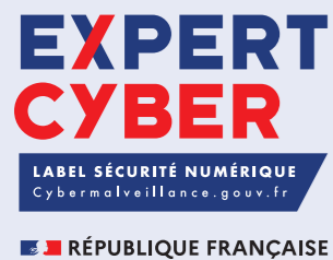
Création du label ExpertCyber.