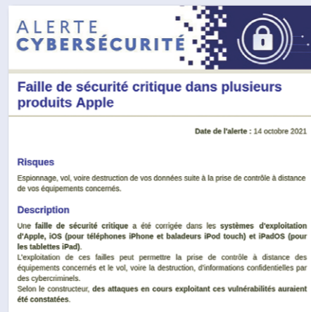
Lancement du dispositif « Alerte Cyber ».